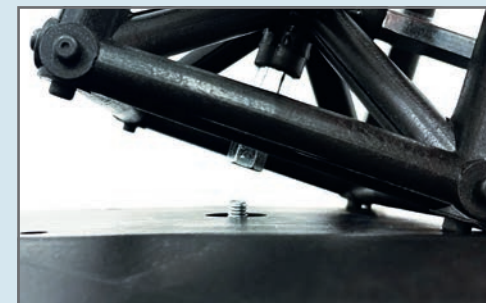
Sterngriffschraube von unten am Würfelverbinder festdrehen.