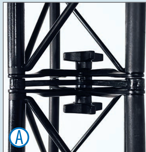
Möglichkeit A: Flachverbinder für gerade Verbindungen Sterngriffschrauben der Module am Flachverbinder festdrehen.