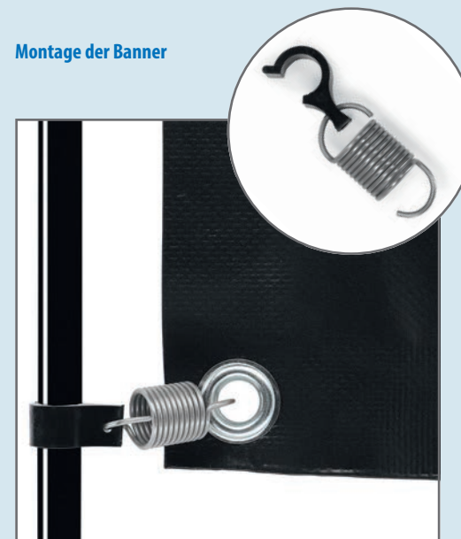
Zur Befestigung der Banner hängen Sie die Ösen in die Federclips und befestigen diese dann am Traversensystem.